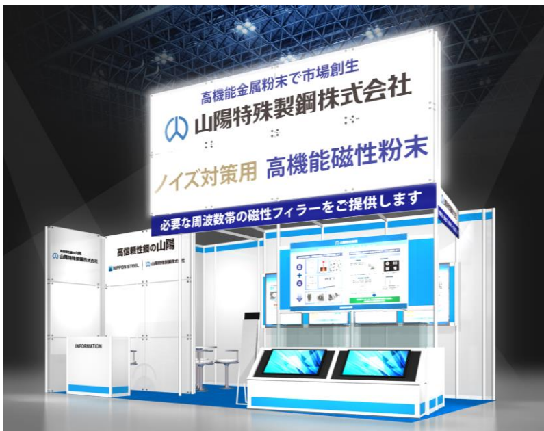
■ 当社の出展ブース（イメージ）

当社では、ノイズ抑制部品の材料として高いノイズ抑制効果を示す高透磁率タイプ扁平粉末、準ミリ波帯（5G通信、車載レーダー）に適応可能な高周波タイプ扁平粉末、および、HF帯やUHF帯のICタグの受信改善に用いる低磁気損失粉末など、用途や周波数帯に合わせた高機能磁性粉末を取り揃えています。